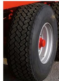
18 x 22,5