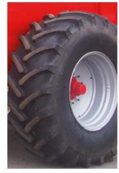
650 x 75 x R32