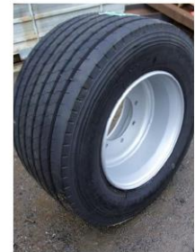
445 x 45 x R195