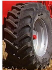
580 x 70 x R38