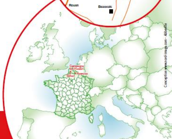
Conception www.ond-imag.com - Abbayille