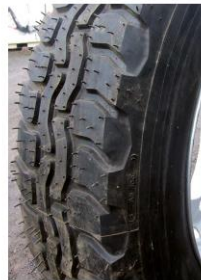
15 x 22,5