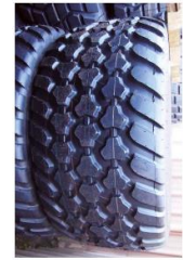
Cargo HD (560)