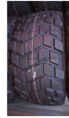
24 x 20,5